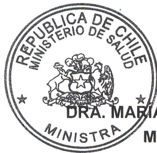
DRA. MARÍA SOLEDAD BARRÍA IROUMÉ MINISTRA DE SALUD